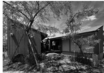
株式会社竹藤商店(小牧市小牧原新田1622)

今後の外構計画が楽しみとなる、とても有意義な見学会であった。関係の方々には感謝の念に堪えない。